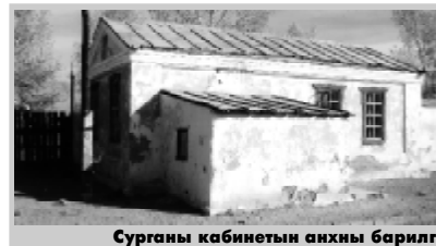
Сурганы кабинетын анхны барилга