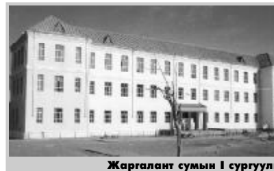
Жаргалант сумын I сургууль